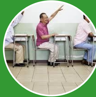
Nordplus täiskasvanu- hariduse programm NP Adult