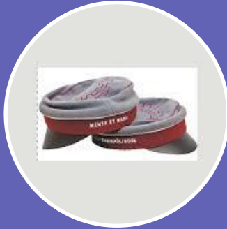
Nordplus kõrgharidus- programm NP Higher Education