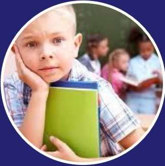
Nordplus Juunior NP Junior