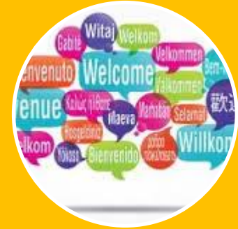
Nordplus keele- programm NP Nordic Languages

Nordplus horisontaalprogramm NP Horizontal